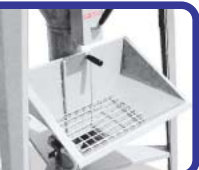
Criglia rompisacchi Grid