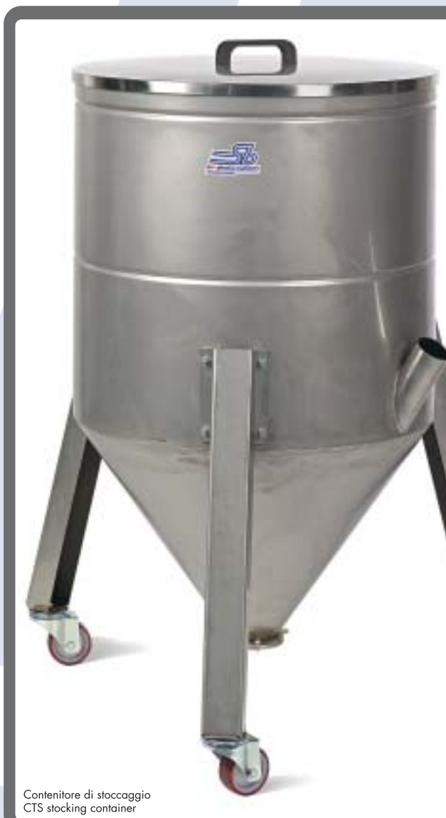
Contentori di stoccaggio CTS stocking container