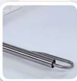
Alimentación integrada con sistema "Venturi"