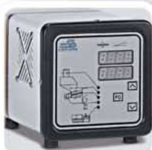
Control a elevada precisión