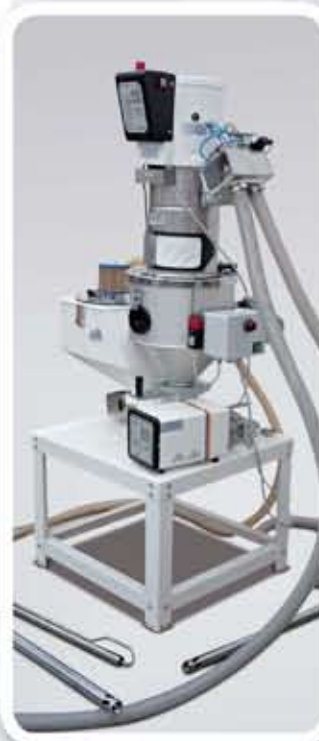
Instalación con alimentador monofásico