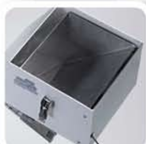
Balanza para el control del peso