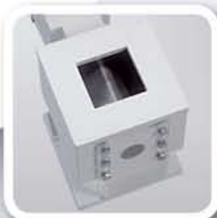
Tronco para mezclado